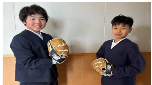
早速6年生に はめてもらいました