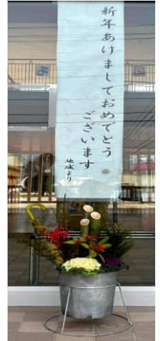
地域の皆様から 門松をいただきました