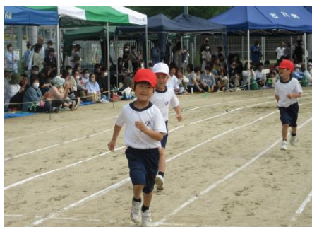
1・2年生 徒競走 「さいごまで はしりきれ！」