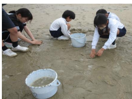
前日準備では、6年生がグラウンドの水たまりを雑巾で取ってくれました