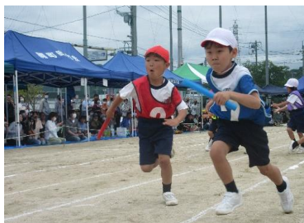
1～6年生選抜による「紅白リレー」