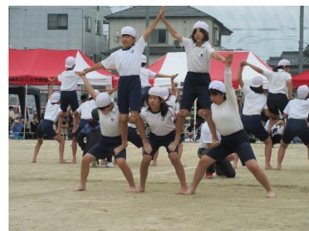
5・6年生 団体演技 「国府の心をついに」

体調面等から当日競技に参加できなかった児童も、アナウンスや救護等、それぞれの係で運動会に参加し活躍してくれました。