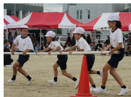
3・4年生 団体競技 「KAZEになれ 台風の目」