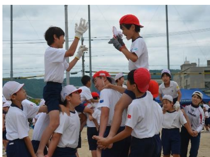
5・6年生 団体競技 「どうする!?赤白 ～国府の陣～」